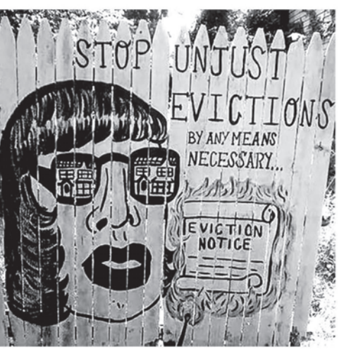
Inquilinos de todo el país alzan su voz en contra de los desaloios.

Por Rachel Krow-Boniske, voluntaria de Causa Justa