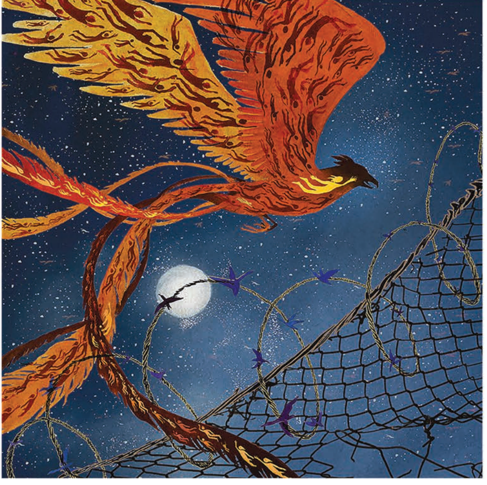
'La migración es mágica', imagen de Jess X Snow

Miles y miles de personas huyeron de la violencia de la guerra civil en esa época, y esta migración forzada continúa hasta el día de hoy con el intervencionismo económico estadounidense, la intervención política reciente de los Estados Unidos y la ayuda a golpes de estado militares y antidemocráticos en Honduras y la guerra contra