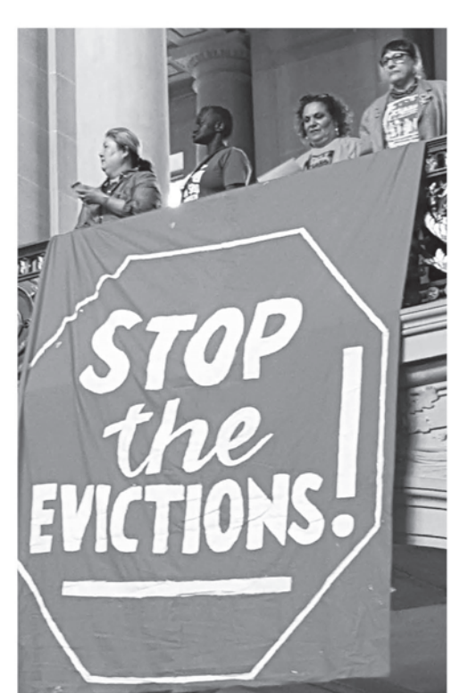
CJJC y otros activistas por los derechos de la vivienda en la alcaldía de San Francisco el 8 de mayo de 2015, exigiendo fin a las crisis de los desplazamientos. Foto

Si bien celebramos la aprobación inicial, estamos conscientes de que queda mucho trabajo por hacer en el futuro para seguir luchando por protecciones para los inquilinos a nivel estatal. La propuesta AB 2925 se encaminara a un voto ante la Asamblea en una fecha futura este mismo mes, y se le podría presentar al gobernador en agosto.