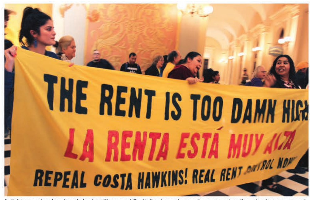
Activistas por los derechos de los inquilinos en el Capitolio el pasado mes de enero, entre ellos miembros y persona de Causa Justa.

"Nos están desplazando. Desalojando. Las personas mayores, las familias y las personas discapa-